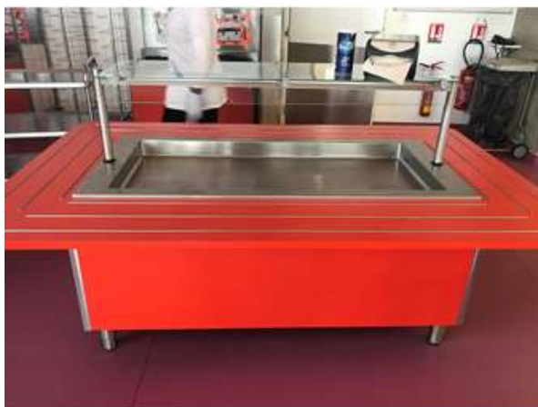
Self-service pour les entrées