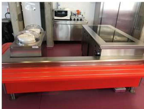
Service assuré par le personnel de cantine pour le plat