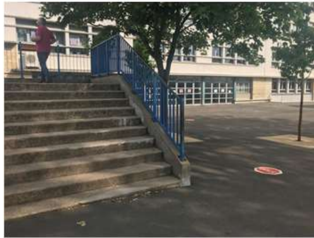
Escalier entre les 2 cours