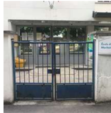
CPA + CP/CM1 21, rue Ernest Renan