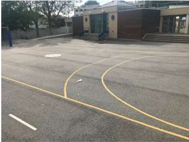
Cour du haut