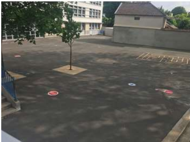
Cour du bas