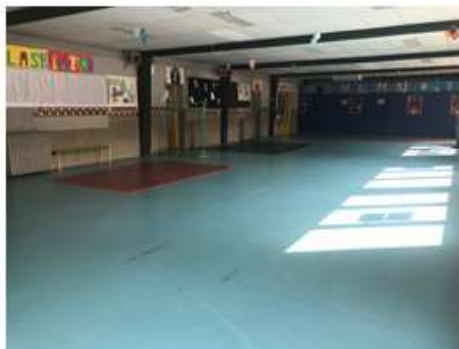
Préau "du haut"