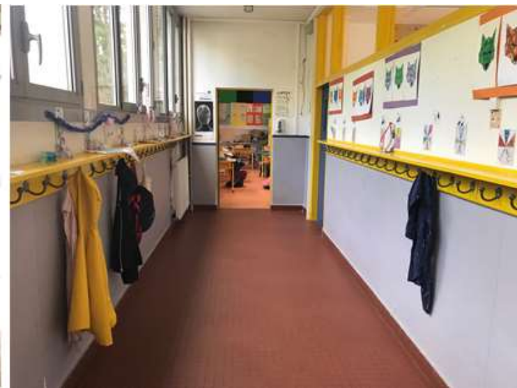
CP-CM1 → RDC