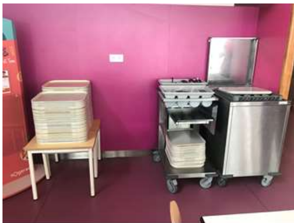
Plateaux et couverts à récupérer