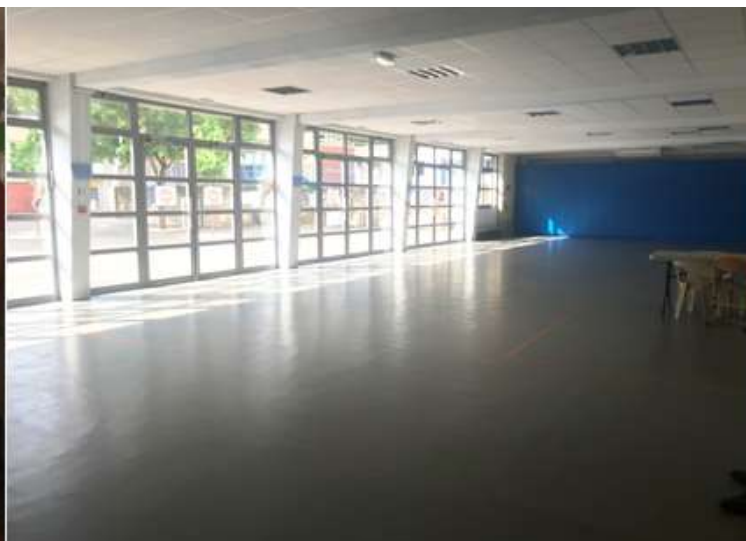
Préau "du bas"