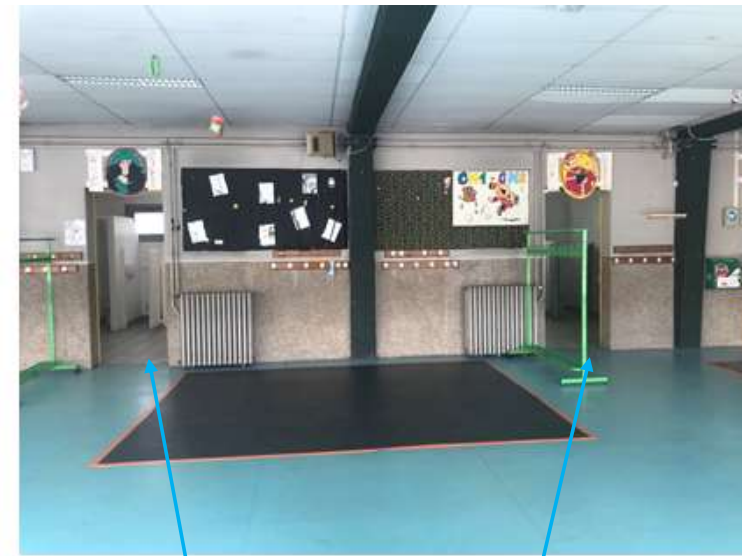
Sanitaires Filles / garçons