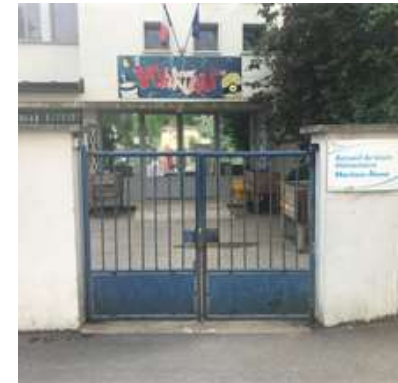
CPB 23, rue Ernest Renan Entrée commune avec le centre de loisirs