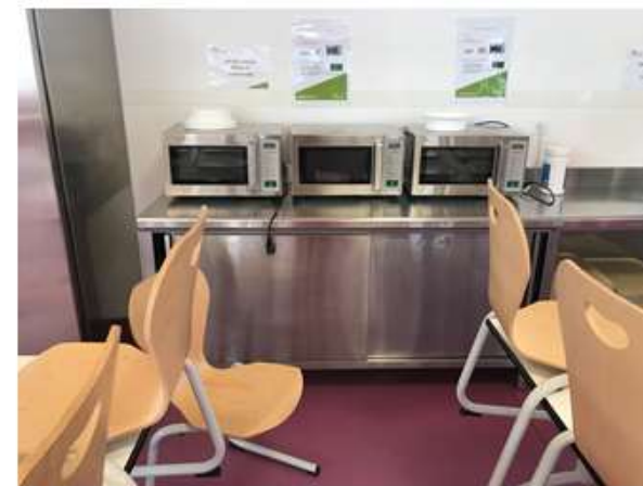
Micro-ondes réservés aux élèves ayant un PAI (Protocole d'Accueil Individualisé lié à des allergies notamment)