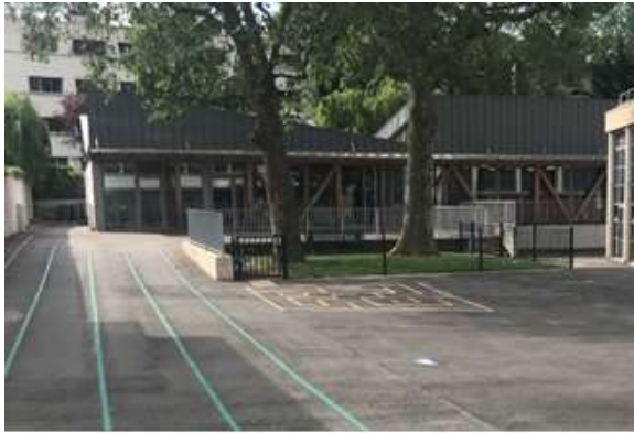
Accès au réfectoire depuis la cour