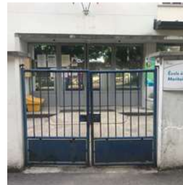
CPA 21, rue Ernest Renan