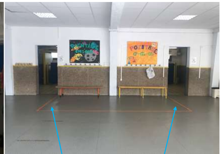
Sanitaires Filles / garçons