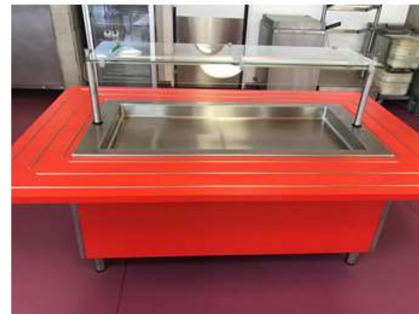
Self-service pour les desserts