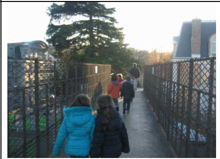
la passerelle au-dessus de la gare

Devinette : sais-tu d'où viennent les colonnes de l'Arc de triomphe du Carrousel à Paris ?