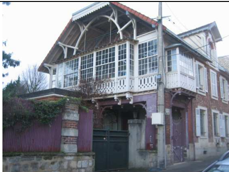
maison Amélie rue Ernest Renan