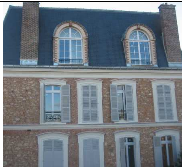
rue Dumont d'Urville